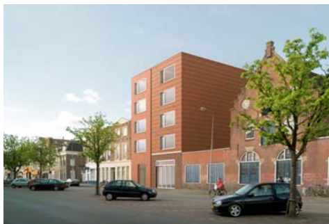
Boterdiep Groningen i.o.v. De Kroon Vastgoed