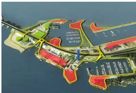
Visie Lauwersoog i.o.v. Provincie Groningen