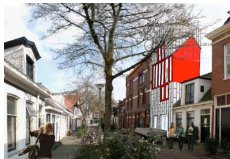
Kleine Appelstraat Groningen i.o.v. MYDOMO