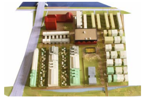
Intense Laagbouw, locatie Damsterdiep