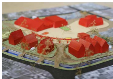
Visie Dorpskern Ried i.o.v. gemeente Franekeradeel, Dorpsbelangen Ried