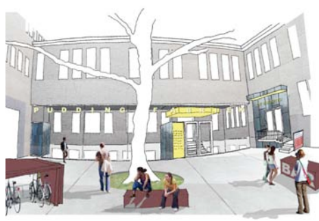
Verbouw en uitbreiding Puddingfabriek i.o.v. dhr. K. Eldering