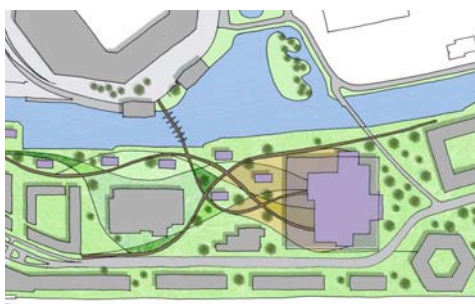
Studie Evenementen Platform Helperpark i.o.v. Parthes B.V. en O.K. Invest