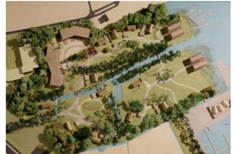
Buitenplaats Patersewoldemeer i.o.v. Geveke Ontwikkeling