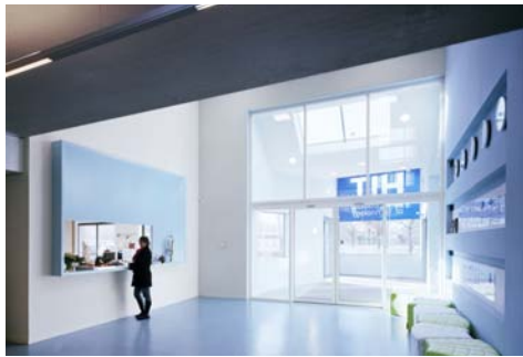
HIT Assen i.o.v. Hanzehogeschool