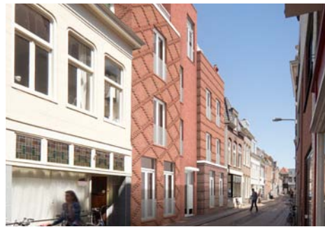
Visserstraat Groningen i.o.v. De Kroon Vastgoed