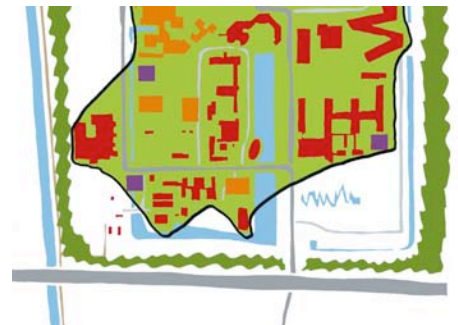
Visie Zernike Science Park i.o.v. Het Akkoord van Groningen