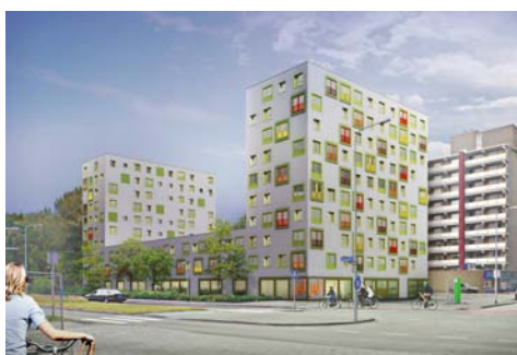
Zonnelaan Groningen i.o.v. Schutte Vastgoed i.s.m. De Huismeesters