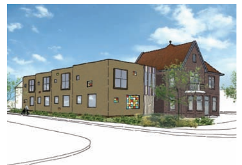
Zorgwoningen Steenwijk i.o.v. Woonconcept Meppel i.s.m. Frion Zorg