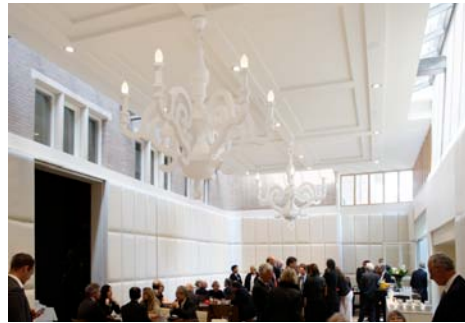
Academiegebouw Groningen i.o.v. Rijksuniversiteit Groningen, afd. VGI