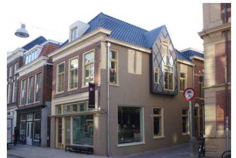
Kijk in 't Jatstraat Groningen i.o.v. Beauvast Groningen B.V.