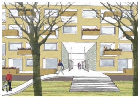
'Z-side' Oosterpark, Groningen i.o.v. Nijestee Vastgoed