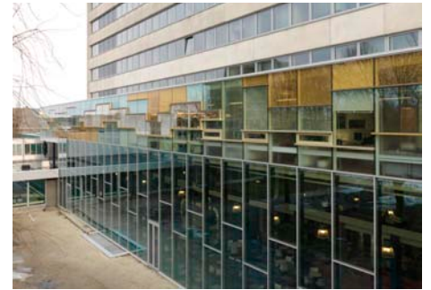
EBR-bibliotheek Zernike i.o.v. Rijksuniversiteit Groningen, afd. VGI