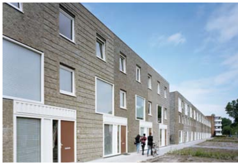
Bonairestraat Groningen i.o.v. Lefier Stad Groningen