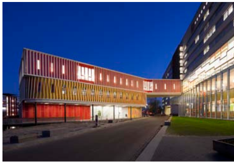
Paviljoen voor het WSN-gebouw i.o.v. Rijksuniversiteit Groningen, afd. VGI