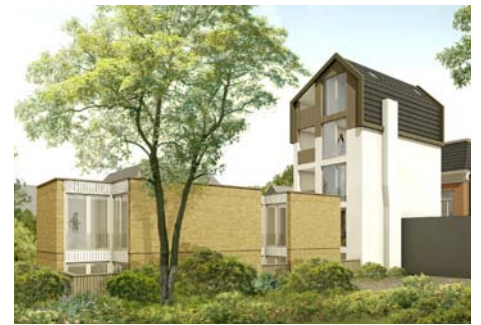
Nieuwe Boteringestraat Groningen i.o.v. De Kroon Vastgoed